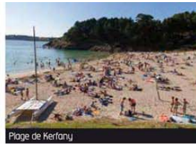
Plage de Kerfany