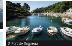
2. Port de Brigneau