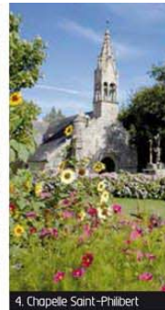
4. Chapelle Saint-Philibert