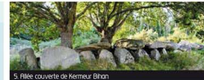
5. Allée couverte de Kermeur-Bihan