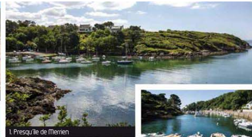
1. Presqu'île de Merrien